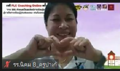
รร.นิคม 8_ครูปาเก๋