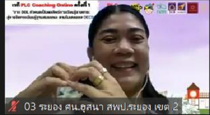
03 ทรายอง ตน.อุสสนา สพป.ระยอง เขต 2