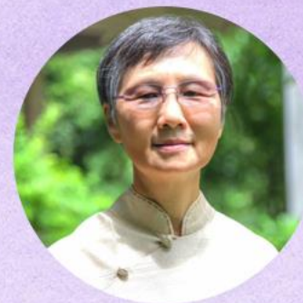
รศ.ประภาภัทร นิยม อธิการบดีสถาบันอาศรมศิลป์ และผู้ก่อตั้งโรงเรียนรุ่งอรุณ