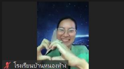
โรงเรียนบ้านหนองห้าง